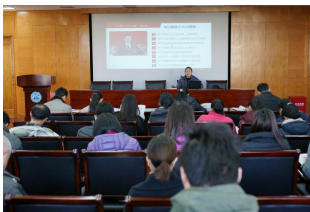
党支部组织全体教职工深入学习十九大精神

2017年，结合党的十九大胜利召开，学校紧紧围绕十九大精神、习总书记重要讲话精神精神和“立德树人”教育根本任务的贯彻落实，继续对教工深化了“美丽中国梦”的宣传教育。学校以十九大精神和国家两个百年奋斗目标、新时代新思想的深入解读，凝聚师生员工立足现在、放眼未来，为实现中国梦打基础做贡献；以课程、主题教育活动、校报校刊、校园文化墙、校园电视台等宣传教育载体不断宣传和弘扬正能量，营造好氛围，形成好风尚；同时通过组织和开展“聋青技十爱十讲”、“青技每月一节”、全国“文明风采”竞赛等多样化的主题教育活动和双创迎评来引导残疾学生培养正确的价值观、人生观，引导青技教育者积极践行社会主义核心价值观的要求、不断提升“奉献特教，以爱育人”的师德意识，引导教职工特别是青年教职工树立正确的价值观和事业观。