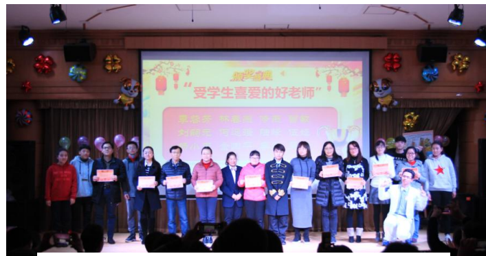
学生为心中“最喜爱的好老师”颁奖