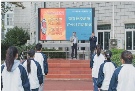
学校开展消防宣传月活动

学校不断建立健全和完善各项规章制度和应急预案，如制定了《配电间安全管理制度》、《消防泵房管理制度》、《校园欺凌处理紧急预案及一般流程》等，组织教职工