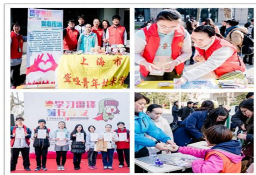
我校学生参加静安区爱心义卖活动

为了大力倡导雷锋精神和志愿服务文化，同时也代表着践行社会主义核心价值观的新要求，在每年“三·五学雷锋日”、“国际志愿者日”期间，校团委、学生会均会大力倡导雷锋精神和志愿服务文化，培养聋学生服务社会、弘扬中华传统美德，开展了“凝聚正能量，树立‘锋’向标”的系列活动。