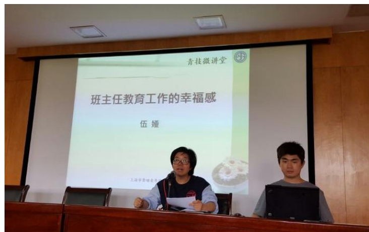
“青技微讲堂”，班主任向同事们分享自己工作幸福感

二是以“提升素养”为抓手，组织教工进行学习。学校党政充分利用每周五的教工集中学习时间，组织教职工开展多种形式的学习活动。2017 年学校先后围绕解读社会主义核心价值观、学习贯彻十九大精神、师德礼仪、心理健康、法制和校园拒绝邪教主题教育、学校校史教育以及教科研、智障学生心理与教育业务讲座等专题，通过专家讲座、素质拓展、参观学习、手语沙龙以及教工读书沙龙等形式，提升教工内在素养；学校继续开展了“青技微讲堂”活动，邀请教工走上讲台，让教工在同伴分享中有更多收获并增进了解，今年共有三位同志就“班主任的幸福”这一主题与同事做了交流分享。在学校党组织的指导下，由学校工会牵头组织了“素养提升”实践活动，教工开展了粉笔字、硬笔、书法、国画等比赛，共推荐了 4 位教