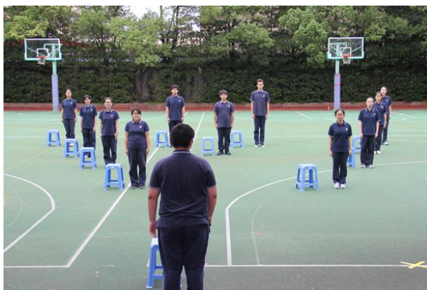
工艺美术高四班的同学在进行站姿的表演

当天下午礼仪比赛分为2个部分进行，唱国歌比赛和基本礼仪比赛。首先是国歌比赛，各班同学在班主任的带领下，认真严肃地跟着音乐用手语唱着国歌，中餐烹饪一2班虽然只有5个同学，但是他们也很认真地大声唱着国歌。之后是礼仪比赛，10个班级根据抽签结果，依次表演站、蹲、坐等基本礼仪姿势，每一个姿势都做到规范，有些班级还增加了礼仪情景表演。