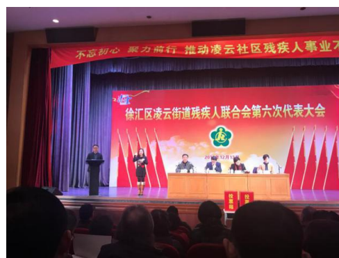
党员教师发挥手语特长服务社区

除了这两个活动以外，各班级团支部通过开展主题团日活动，学习雷锋事迹、弘扬雷锋精神。每个班级也根据自己的实际情况开展学雷锋活动和志愿服务活动。如一年级同学在校园中开展公共区域环境保洁活动以及为教工擦车的服务；二年级同学到光华园社区为居委会分发报刊杂志、出黑板报等志愿服务；三年级同学到凌云街道图书馆帮助整理、打包书籍和录入书籍资料等志愿服务。青技学子们正用自己的实际行动继续秉承和发扬雷锋精神，让雷锋精神成为薪火相传的正能量！在第32个国际志愿者日来临之际，我校党员全程参与到学校组织的爱心义卖活动中，为爱心站台助力；党员发挥手语特长，为长桥街道、凌云街道残疾人联合会做手语翻译志愿服务；党员参与“向九寨沟灾区献爱心”募捐活动；党员同志与在校学生结对，给予他们生活和学习上的关心帮助……雷锋精神已经融入了师生们的生活，给师生们带来了崇高而温暖