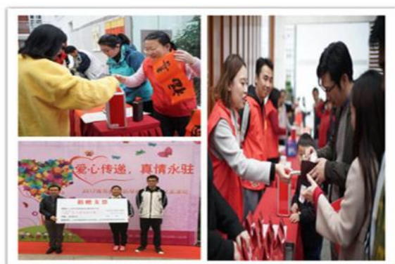
12月3日活动当天，家长和社区的人们积极参与义卖活动

学校还充分利用各类社会资源，对学生开展德育教育。如继续深入开展了“请进来 走出去”活动（邀请优秀聋人代表、全国劳模、我校名誉校长戴目和校优秀毕业