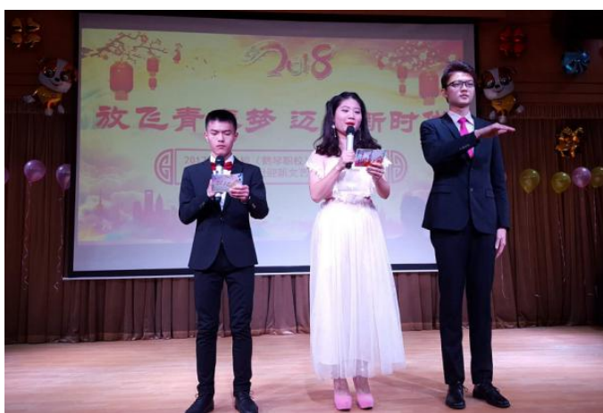
2017年“放飞青春梦，迈向新时代”校园艺术节闭幕式

“青技校园艺术节”是学生技能展示的舞台，也是学生自信心培养的平台。为期一个月的艺术节活动的宗旨是“搭建舞台，让聋生秀出自我、超越自我”，活动内容不仅有技能秀、创意秀，还有天天演、天天赛，更有学生优秀作品、创意作品的集中展示，最后以“元旦迎新文艺汇演”收官，学生们可以在这期间全方位的展示自己。通过艺术节的系列活动，引导学生发现自己的特长，发挥自己的潜能，展示自己的才艺，并在充分展示自己的同时进一步增强自信心，最终可以自信自强地走出校园、走进社会、融入社会，从而真正达到学校“以人为本，育残成材”的育人目标。自2001年首届聋