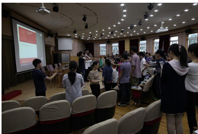
各班代表上台带领学生们练习手语国歌

《中华人民共和国国歌法》，并于2017年10月1日起施行。升旗仪式结束后，教导处组织大家练习手语国歌，并邀请了各班手语较标准的代表带领大家一起练习，今年我们首批招收的辅读生班的同学们也认真练习，同学们在国歌声中一遍遍认真地练习，用行动向国旗敬礼。