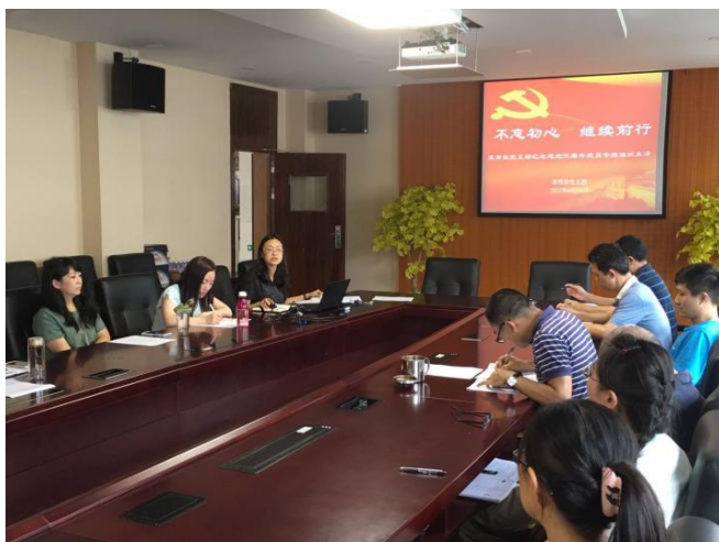
“不忘初心 继续前行”主题党日活动

党员大会、党小组学习等对党员开展思想教育和党性教育，先后组织了“知行合一，做守纪律讲规矩的表率”、“学习市第十一次党代会精神”、“践行四讲四有要求，以实际行动迎接党的十九大”、“学习廖俊波黄大年先进事迹”、“习总书记7.26讲话精神”、“学习贯彻十九大精神，做好新时代排头兵和先行者”、“学习新党章”等党员专题学习和专题组织生活会，同时利用“青技党员e空间”组织开展了多次网上专题讨论活动，党员在学习中统一思想、提高认识；七一前夕，支部开展了“不忘初心 继续前行”党日活动，组织党员重温入党誓词、走进市内各红色基地，党员在大量的历史资料和真实的记录中对党的发展历程进行再学习。在组织党员深入学习的基础上，党支部开展了“品质 忠诚”